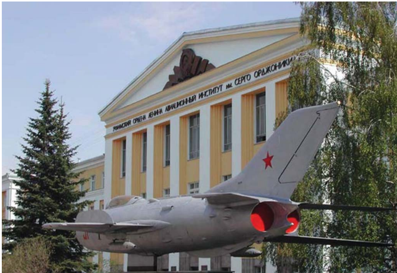
Уфимский государственный авиационный технический университет